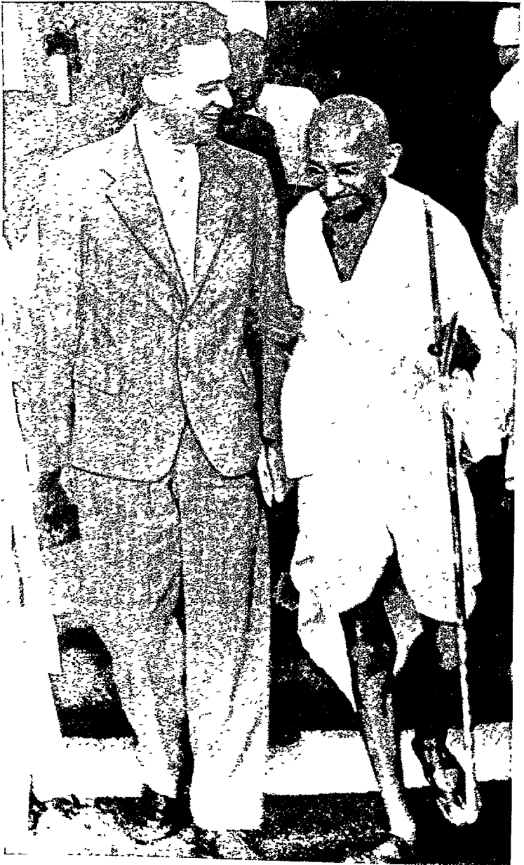
सर स्टैफर्ड क्रिप्सके साथ